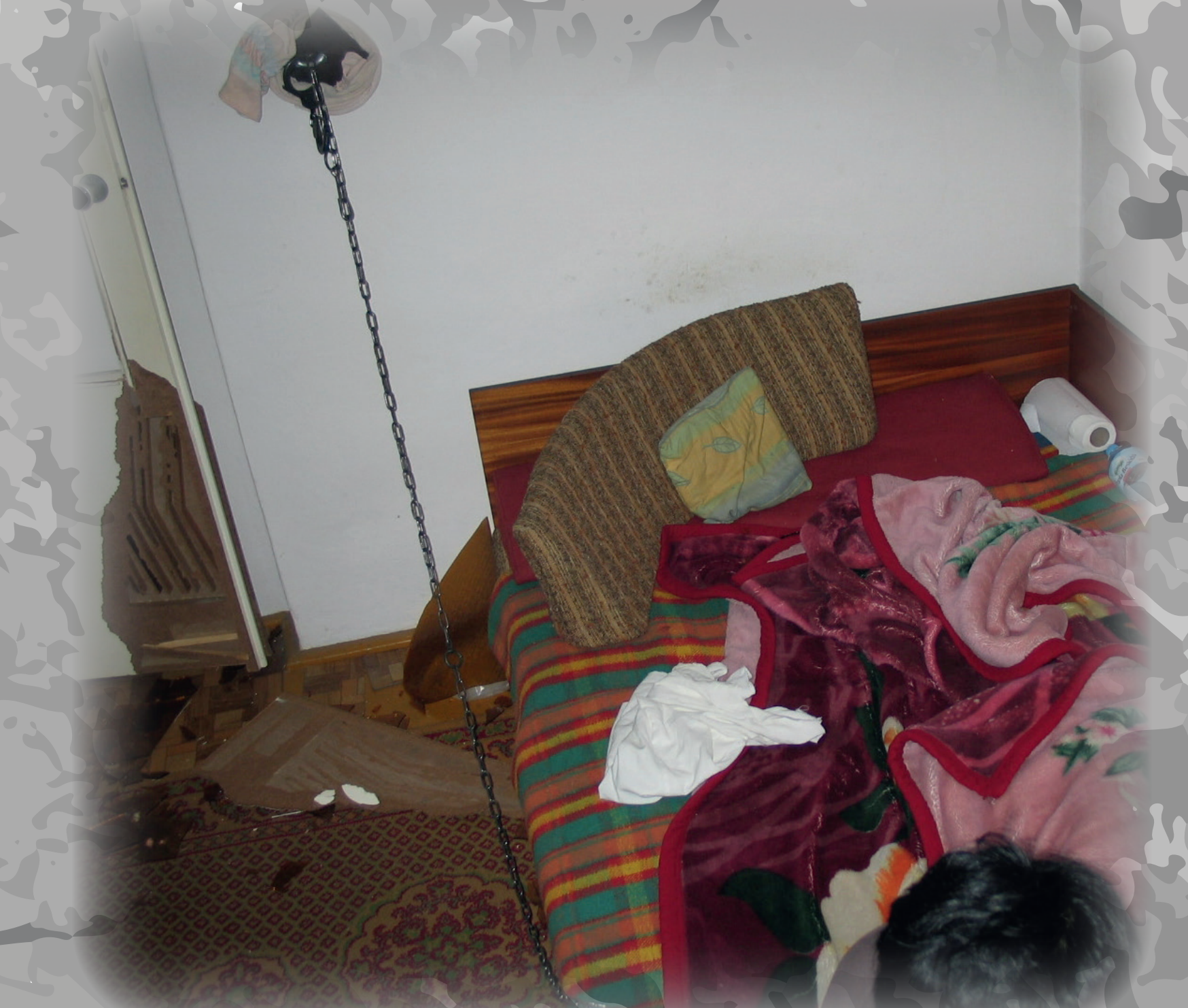
fol. Komenda Stołeczna Policji